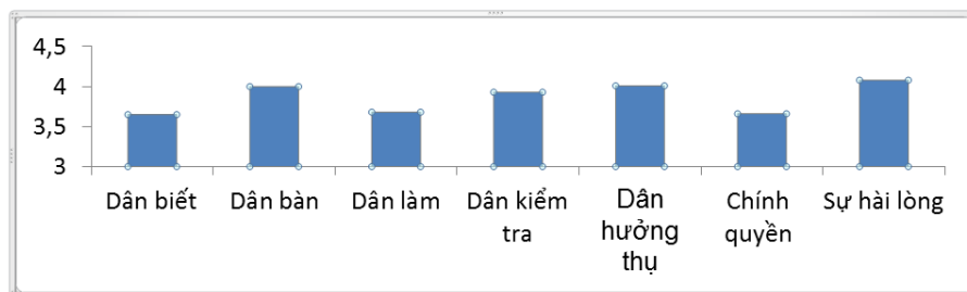
Biểu đồ 1. Đánh giá của người dân về các thành phần

cao năng lực của chính quyền địa phương. Thành phần được đánh giá cao nhất là Dân hưởng thụ (4,01/5 điểm). Như vậy, người dân cho rằng Chương trình NTM thật sự có vai trò tích cực đến cuộc sống của họ.